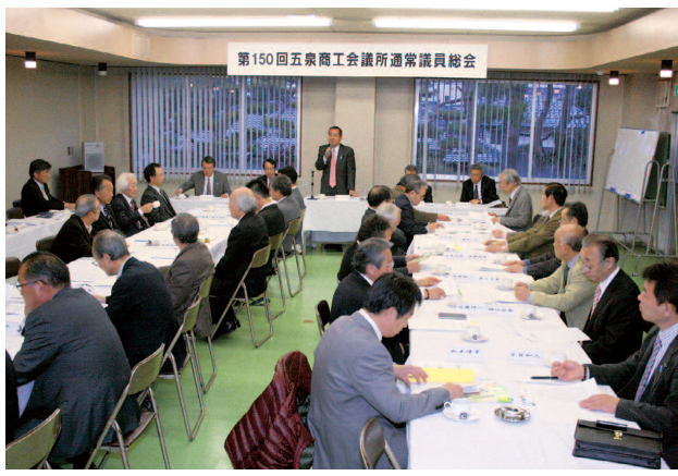
第150回五泉商工会議所通常議員総会

五泉商工会議所は平成25年度の事業計画並びに収支予算を審議する第150回通常議員総会を3月25日開催し、原案通り可決された。25年度の重点事業は次の通り。 ①五泉市観光協会との連携を深め、五泉の伝統文化、歴史、地域資源を活用した観光事業の促進―春の花シ ②基幹産業並びに商業界活 ③市当局との連携 ④中小・小規模事業者の経営支援事業の推進―中小企業円滑化法の期限到来を踏まえた、資金繰り計画・経営改善計画策定支援等を推進する。中小・小規模事業者が消費税引き上げ分を円滑に価格転嫁できるように相談支援を推進する。会員企業の計画的な巡回相談の充実と新事業や経営革新及び創業、企業等の事業者に対して支援指導の推進を図る。 ⑤会員増強と経営基盤の確立―地域総合経済団体として会員増強による組織基盤強化と、各種共済事業の積極的推進による手数料収入など会議所財政強化を図る。