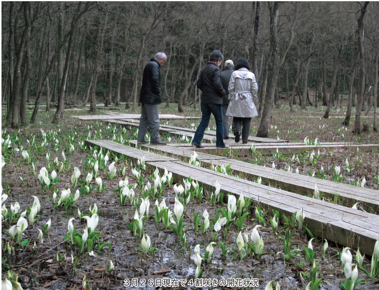
3月26日現在で4割咲きの開花状況