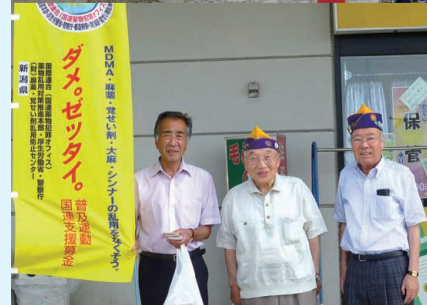
▲薬物乱用防止キャンペーンに参加中