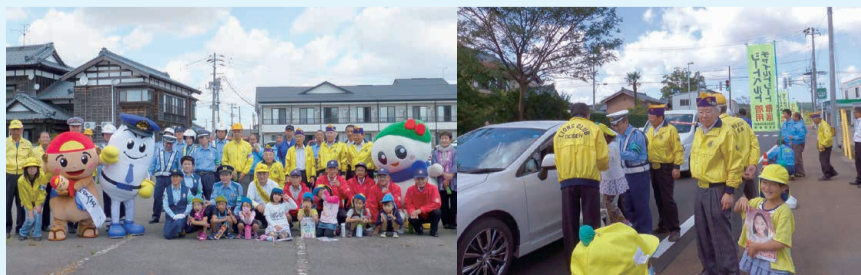
▲秋の交通安全街頭指導に参加