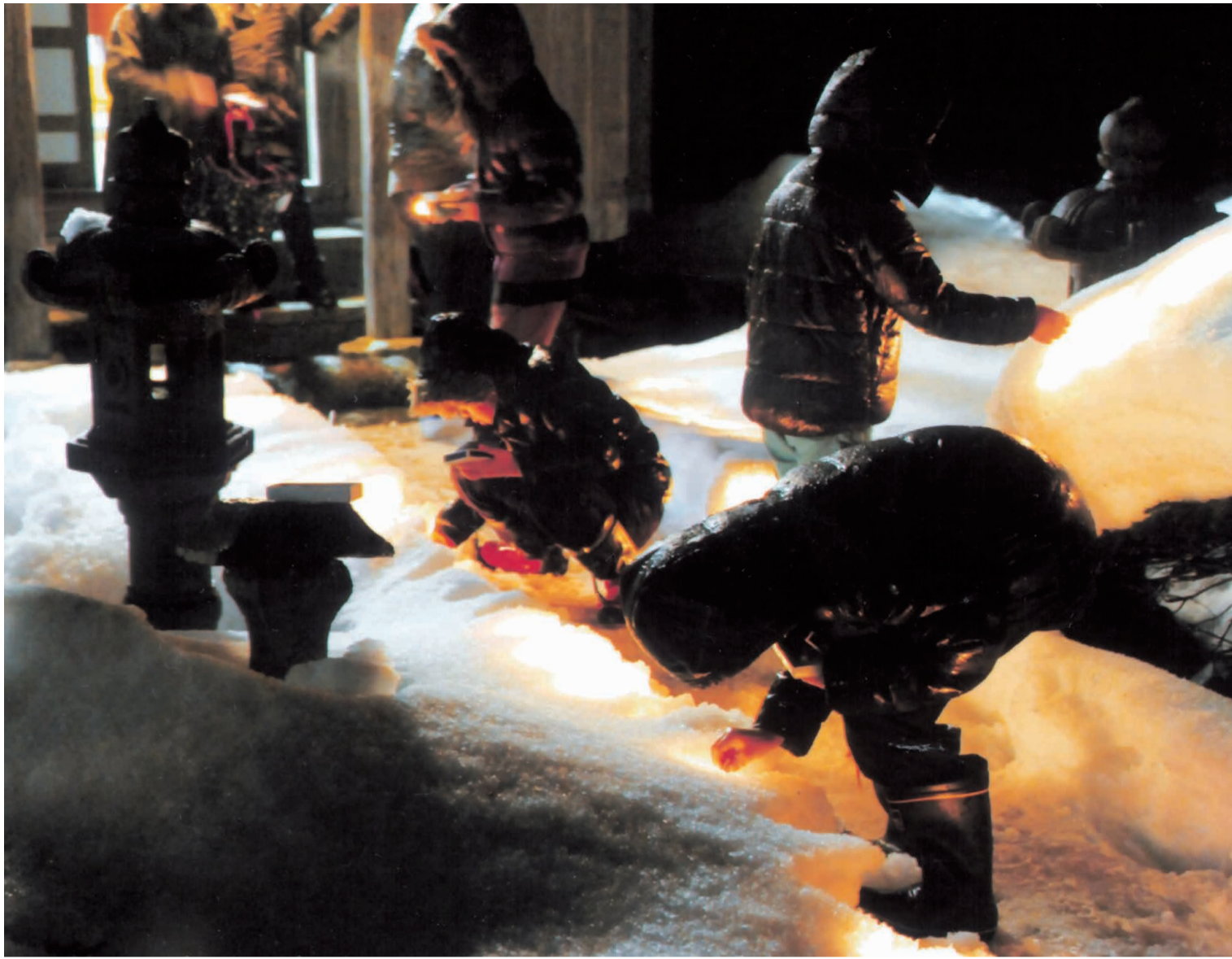
「天神祭」(幅地区の天満宮)