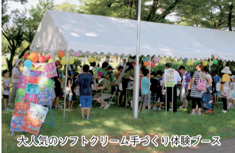
大人気のソフトクリーム手づくり体験ブース

く、多くの子供達に受け入れられる内容にすることを前提に企画、運営させていただきました。次回開催の機会がありました際には、今回の経験を十分にいかし、さらに子供達に喜びと学びを提供できるように心がけたいと考えております。