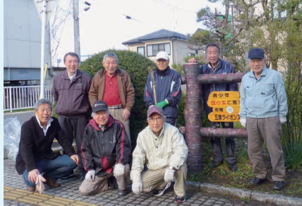
▲駅前広場でライオンズ庭園の手入れ