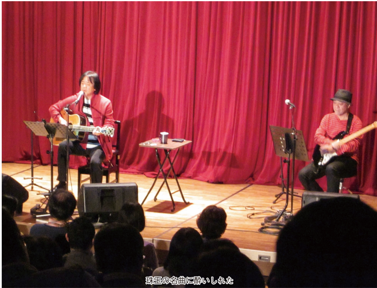
珠玉の名曲に酔いしれた