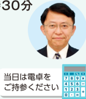
当日は電卓をご持参ください