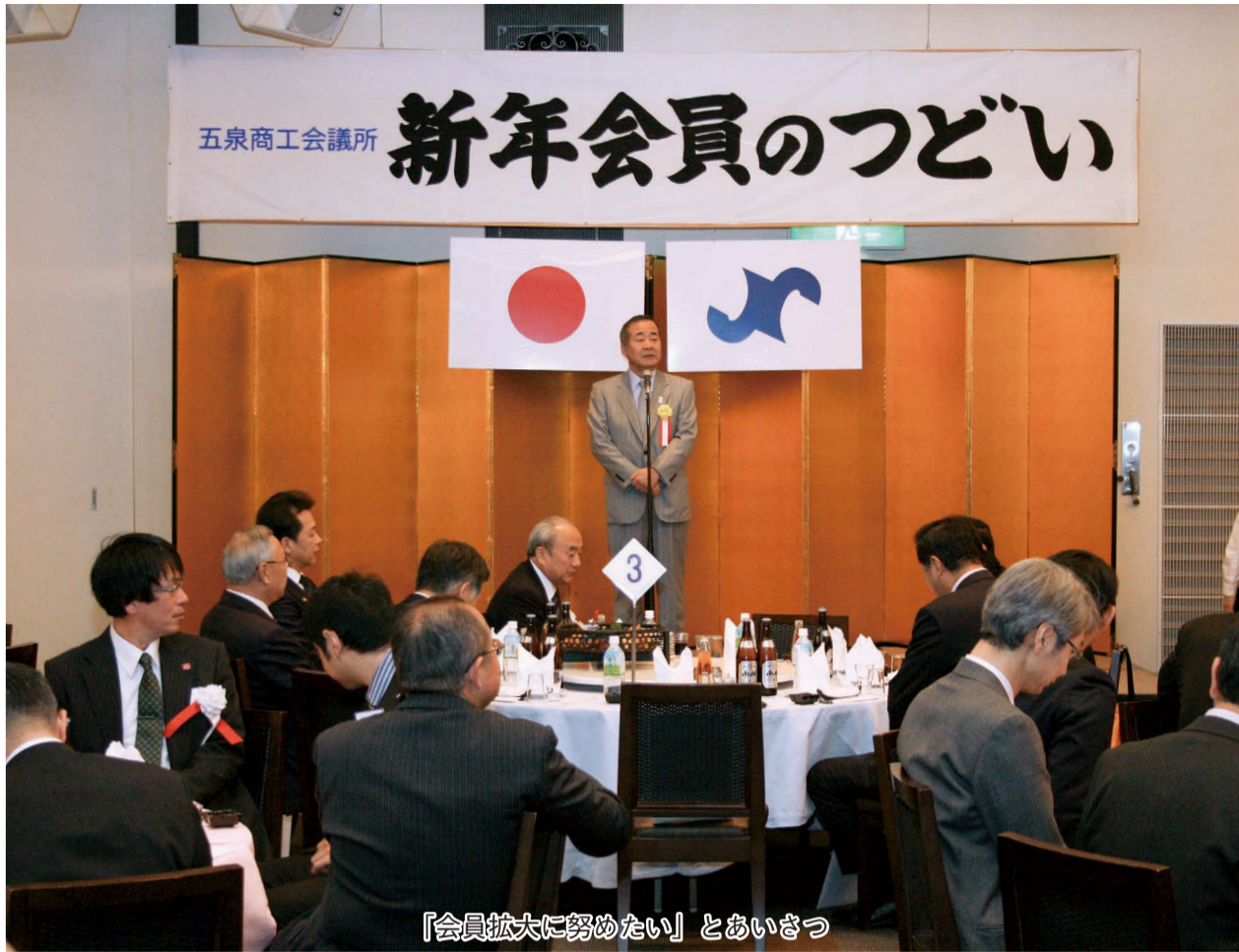
「会員拡大に努めたい」とあいさつ

新春恒例の五泉商工会議所「新年会員のつどい」が1月19日、ガーデンホテルマリエールで開催され、来賓や会員など約160名が集まり新春を祝った。