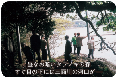
昼なお暗いタブノキの森 すぐ目の下には三面川の河口が

道橋が架してある。それも人ひとり分の小道だ。古木の枝が覆いかぶさるようになっている。明後44年5月、魚つき保安林指定の標識があり神社もある。総面積は2・4畝。人の散策を考えていないのでこの先、道がない。ここは天然更