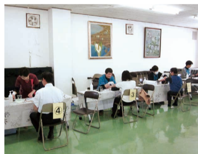
結果は後日、本人宛に送付され、がんの早期発見に一役買っている。

約120名が受診 がん予防検診 五泉商工会議所では会員事業所の経営者や従業員を対象とした採血による「がん予防検診」を2月9日に開催した。 当日は(一財)健康医学予防協会の職員らによって参加者約120名の採血が行われた。今年は乳がん検査も追加され、健康に関する意識の高さがうかがわれた。