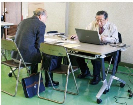
相談会では市内税理士と当所職員が担当し、

五泉商工会議所では平成29年分の所得税青色申告の決算書、確定申告書作成相談会を2月14日、15日、19日、20日の4日間開催した。 相談会では青色申告だけでなく白色申告の事業所得者に対しても手続きを行い、期間中は約75名が相談した。