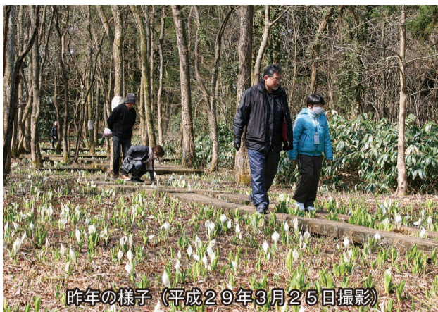
昨年の様子(平成29年3月25日撮影)

ミズバショウ3万株が自出)では、ミズバショウの花が今月下旬から4月上旬に見ごろを迎える。