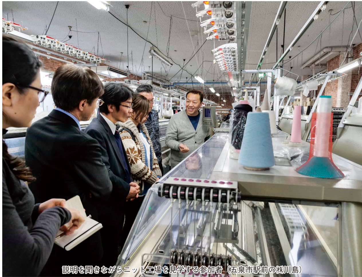
説明を聞きながらニット工場を見学する参加者（五泉市駅前の櫛川島）