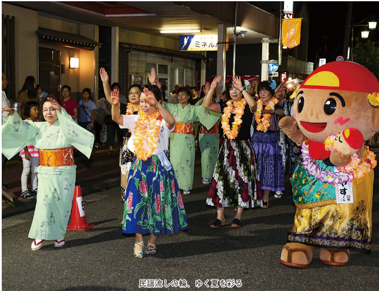
民謡流しの輪、ゆく夏を彩る