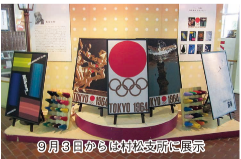
9月3日から村松支所に展示

▽入場料 無料 吹奏楽部、チアリーダー部、ダンス部、リーダー部の3部構成による発表が予定されている。なお、これよりも前に吉沢から総合会館までの約1kmを、12時40分頃から30分かけてパレードする。 問合せは五泉市スポーツ推進課(電話42-5194)まで。