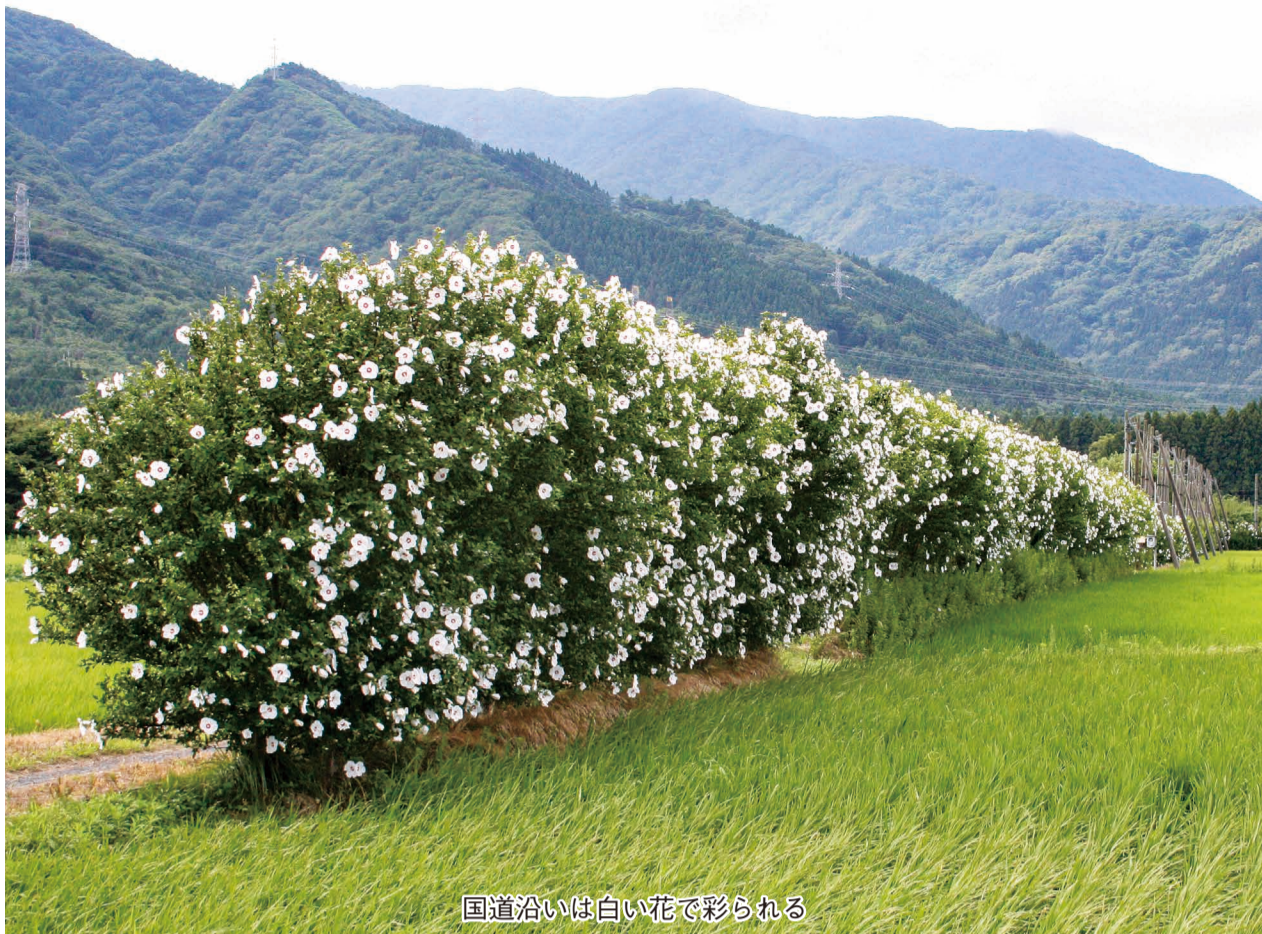
国道沿いは白い花で彩られる