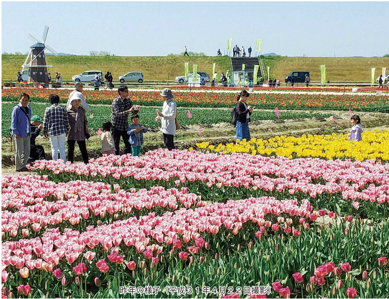
昨年の様子（平成31年4月22日撮影）