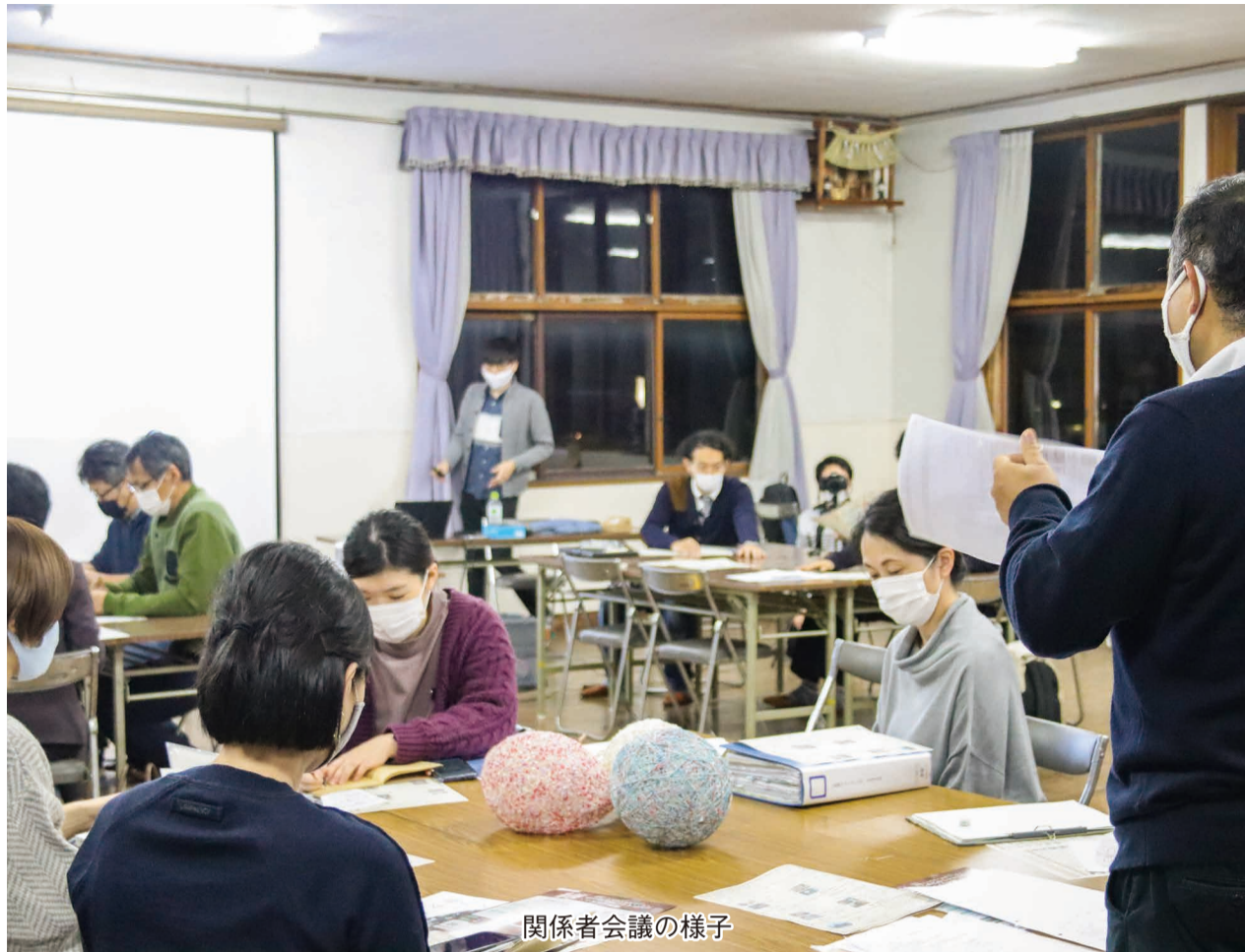
関係者会議の様子