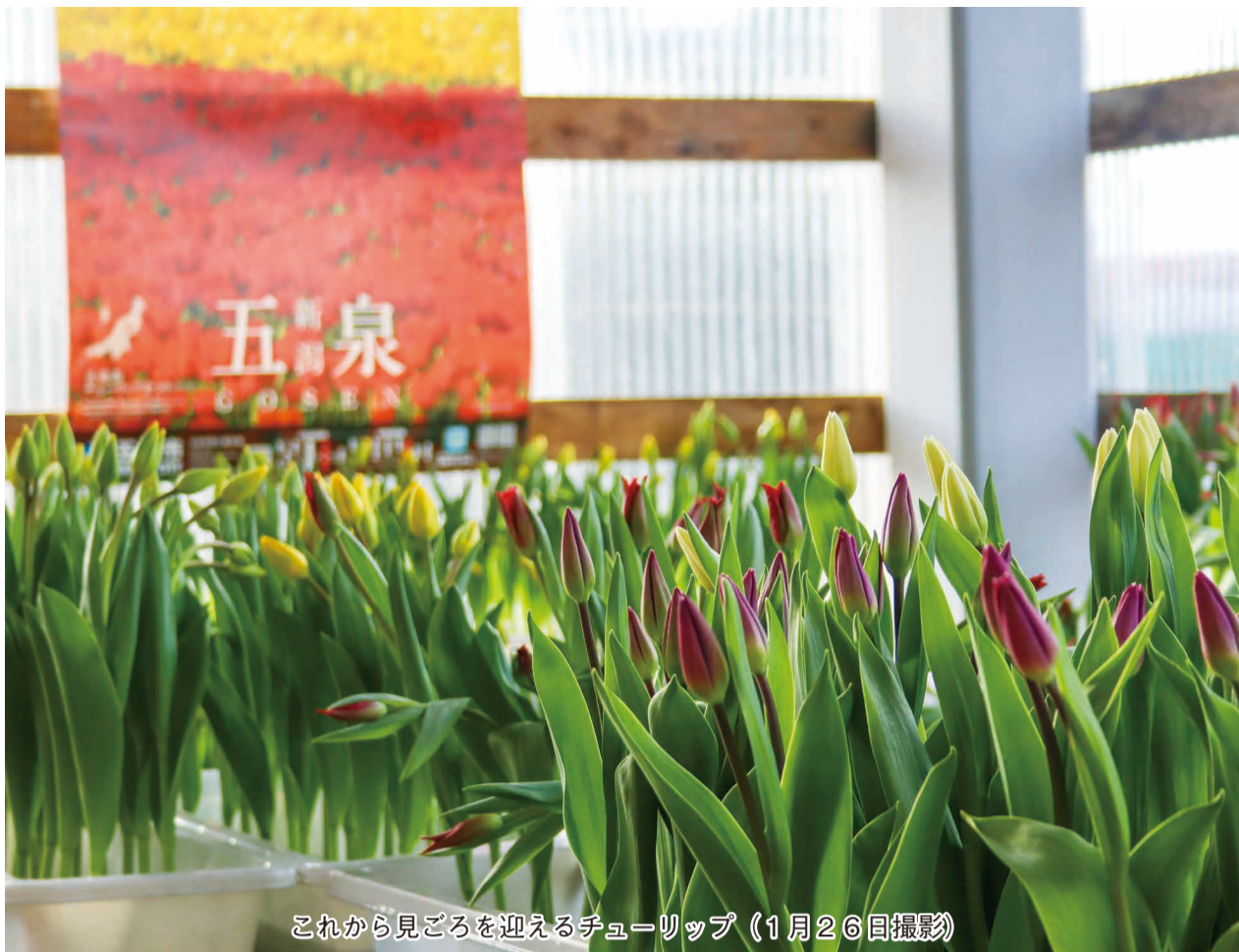
これから見ごろを迎えるチューリップ（1月26日撮影）