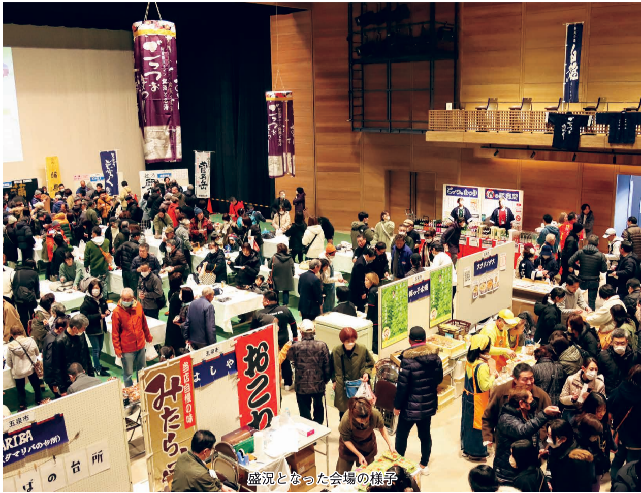
盛況となった会場の様子